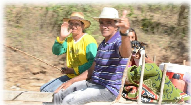
Figura 6- Lula e sua esposa Lourdes - carreata de São José

Quando fazemos uma observação atenta em uma festividade como esta, percebemos que tudo isso constitui uma espécie de representação de identidade, como se os pequenos agricultores e criadores buscassem mostrar sua importância, que em nosso ver muitas vezes passa despercebido. Boa parte da sociedade esquece que Lagoa do Ouro é um município que tem suas raízes econômicas intimamente ligadas às atividades Agrárias.