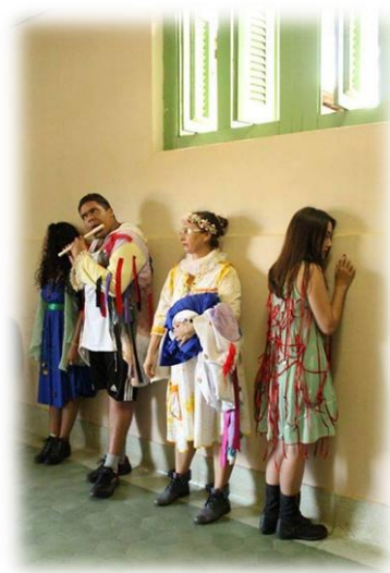
Imagem 01: (Lou)Cure-se! - Instauração Cênica apresentada do Hospital Psiquiátrico Dr. João Machado. Cena Corredor. CRUOR Arte Contemporânea.

residentes em psiquiatria e psicologia. Existe ainda 40 leitos de clínica médica que funcionam no anexo deste serviço como retaguarda aos pacientes dos corredores do Hospital Geral Monsenhor Walfredo Gurgel.