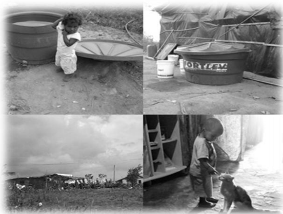
Foto 02: Ação coletiva pela posse do território quilombola

fazendeiros da localidade, em com condições de extrema necessidade. Ao romperem com as relações de trabalho com os fazendeiros, as condições de sobrevivência ficaram ainda mais difíceis, pois já não podiam contar mais com o trabalho nas fazendas e nem usufruir das benéficas advindas da terra. Os quilombolas que aderiram ao movimento passaram a morar em barracos de lonas conforme apresenta a seguir.