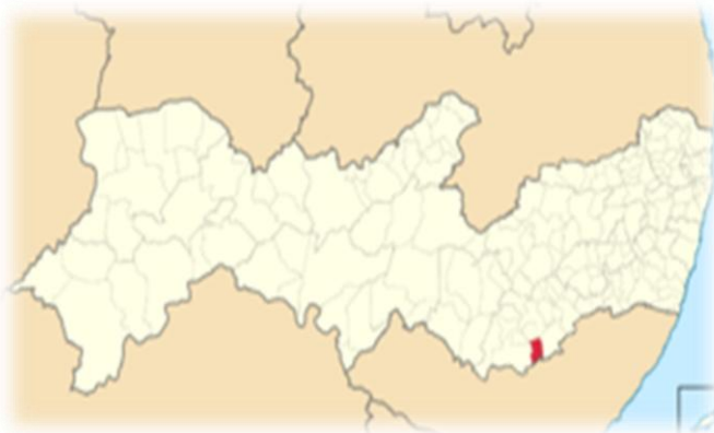
Figura 1- Município de Lagoa do ouro