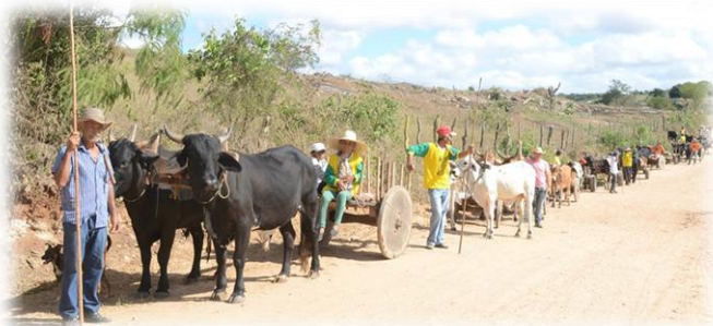
Figura 5 - Carreata de são José.

Carros de bois não são apenas lembrados em momentos de trabalho, nos últimos 10 anos grupos de pequenos agricultores e criadores organizam uma maratona de carreatas para comemorar as boas colheitas, como também os dias religiosos (dia dos santos mais populares). Mesmo esse meio de locomoção não sendo mais utilizados como em outrora, as tradições de certa maneira resistem no espaço “negociando” sua existência em um novo tempo, Barbosa (2015).