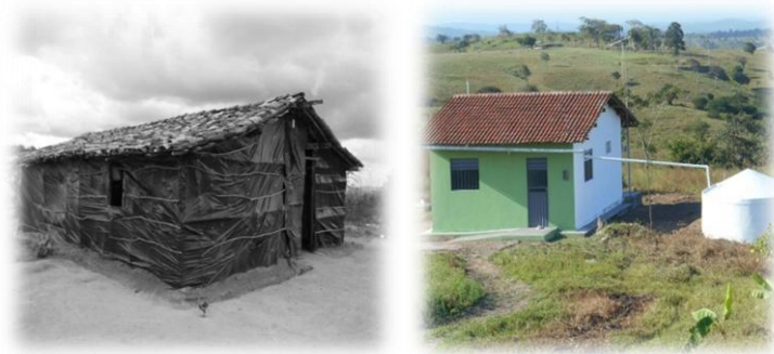
Foto 03: Do mocambo à casa de tijolo

O reconhecimento e a posse de terras são balizas legais, mas entre a reivindicação e a expedição do título existe um longo processo marcado por várias polaridades como silenciamento e afirmação, invisibilidade e imposição de presença, apropriação de discursos e construções identitárias.