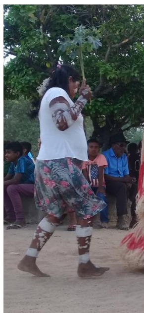
Fotografia 04 – Mulher utilizando a pintura corporal – 2018.