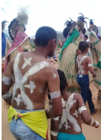
Fotografia 01 – Padrinhos durante o Menino do Rancho – 2019