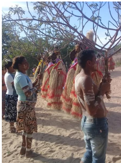
Fotografia 02 – Dançadores durante a Festa do Umbu – 2019