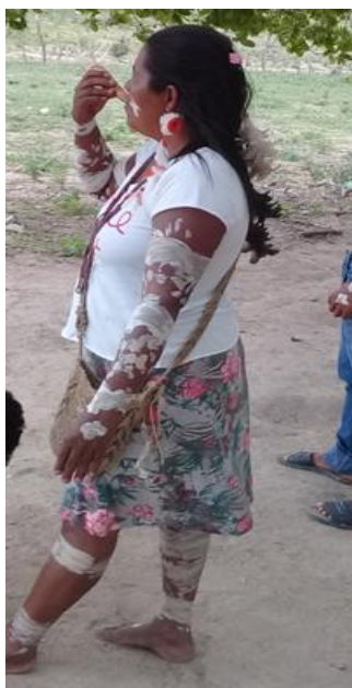
Fotografia 03 – Mulher utilizando a pintura corporal – 2018.

Na tradição Jiripankó, além da pintura masculina, existe o costume utilizado pelas mulheres durante os eventos religiosos. De modo discreto, a pintura feminina se assemelha à masculina, possuindo o mesmo sentido de proteção aos participantes da religião. Contudo, os traços entrecruzados cedem lugar às roupas recatadas e a pintura realizada nas mãos, braços, pernas e rosto, conforme observamos nas fotografias a seguir.